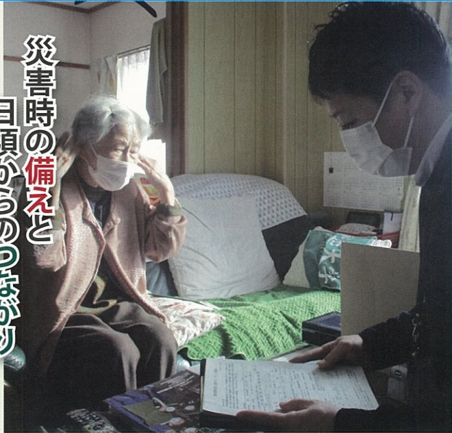
災害時の備えと 日頃からのつながり

災害時に備えて、近所の方などに無理のない範囲で避難の支援（災害情報の伝達や避難所までの移動の手助けなど）をお願いします。日頃からの近所の声掛けや見守りなどの『つながり』が、災害時にも大きな支えになります。