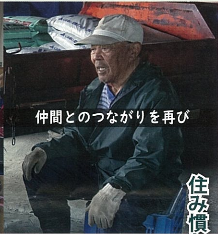
仲間とのつながりを再び