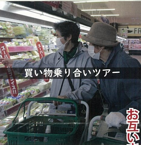
サロン同士の交流