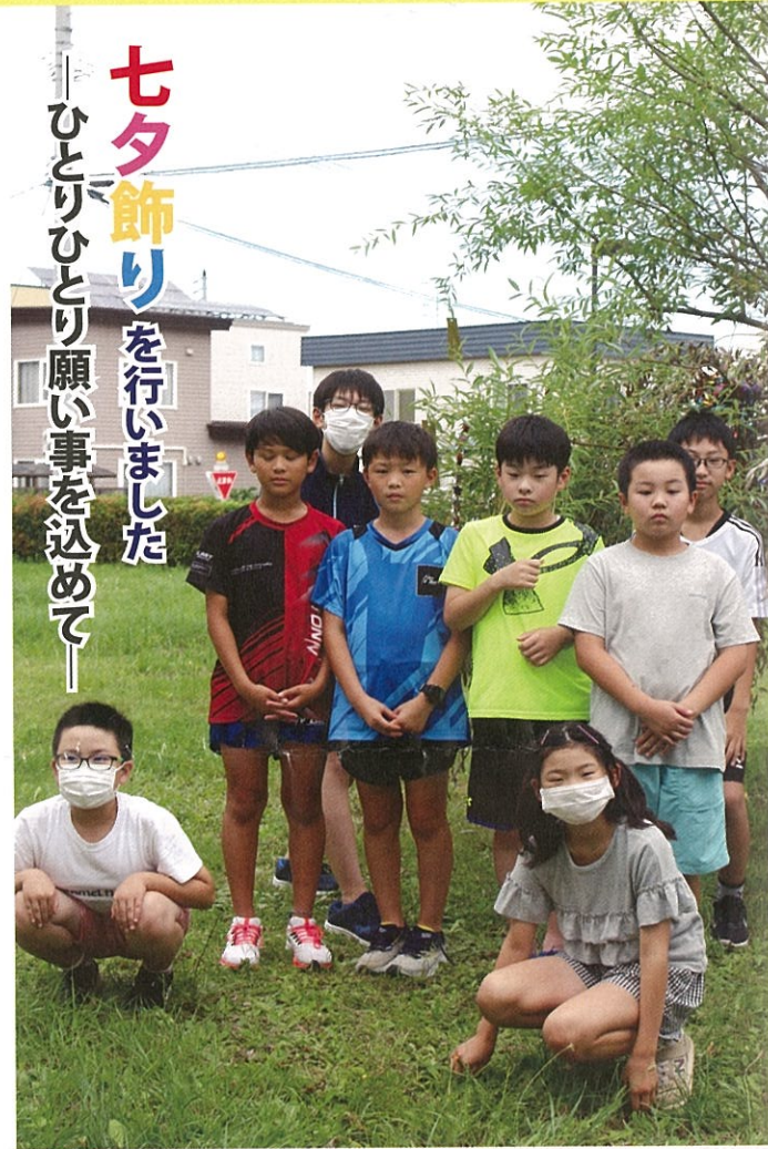
七夕飾りを行いました ひとりひとり願い事を込めて

児童センターは、月曜日から土曜日の午前九時から午後五時まで開館しています。なお日曜日と祝日は休館です。 ※幼児は保護者同伴での利用となります。