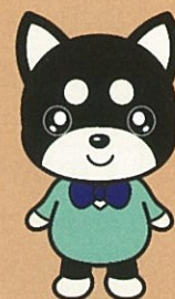
成年後見マスコット 後犬(こうけん)ちゃん

北空知成年後見相談センターは北空知1市4町の委託を受け、社会福祉法人 深川市社会福祉協議会が運営しています。なお、成年後見制度の相談は、北空知各市町の担当所管で引き続き対応しており、北空知成年後見相談センターと連携して取り組みます。